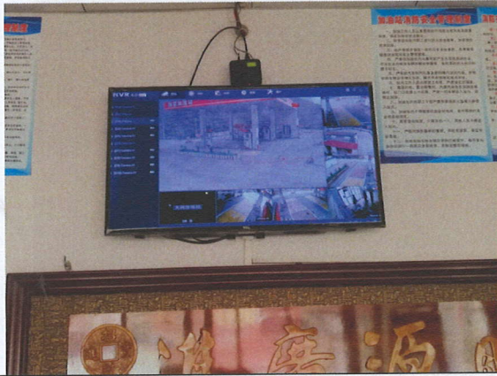
视频监控集中显示器