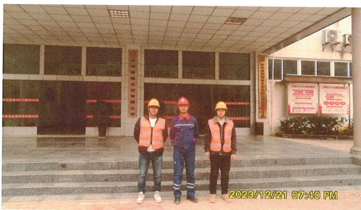
评价师办公楼照片