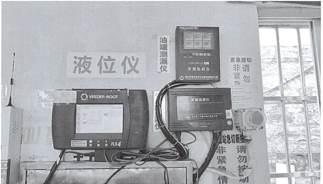
液位仪、渗漏检测仪、紧急切断