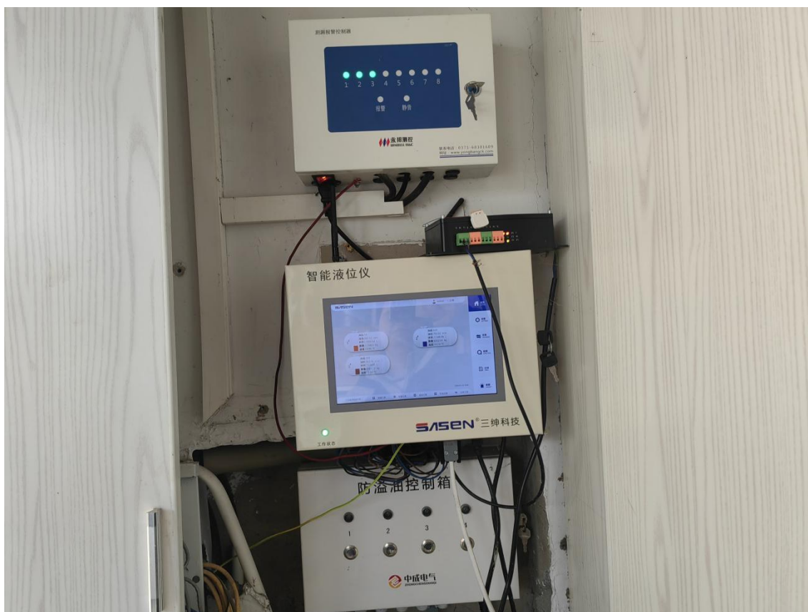
液位仪、渗漏检测仪