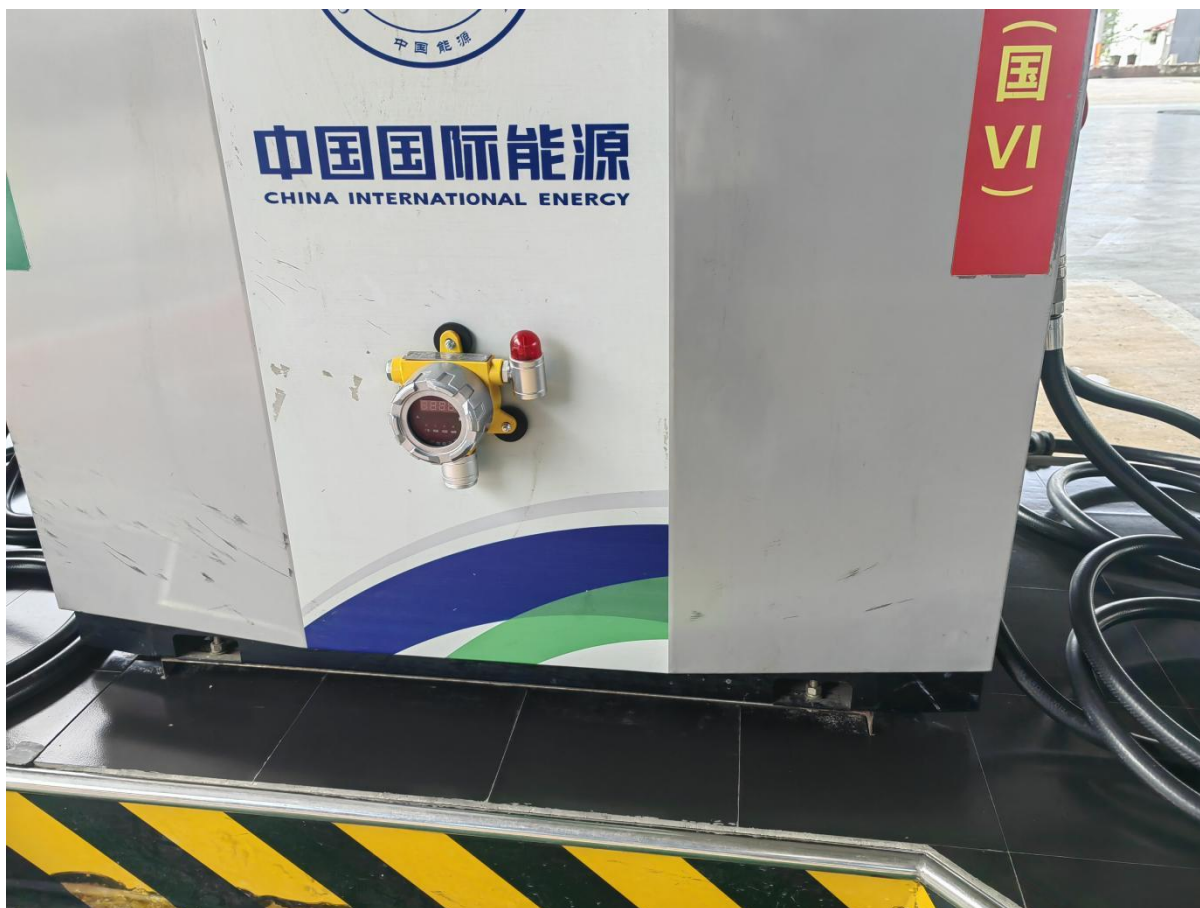
可燃气体检测报警装置